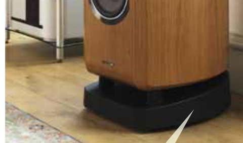
А кустика Bowers&Wilkins 802 Diamond заслуживает самого пристального внимания.

U2 нужно слушать на стадионе, а симфонии Сергея Прокофьева – в консерватории, это факт. Но если задаться целью, то и дома музыка может звучать не хуже.