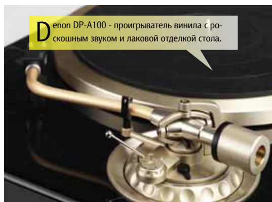
D enon DP-A100 - проигрыватель винила с роскошным звуком и лаковой отделкой стола.