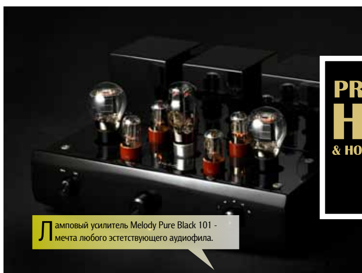
Л амповый усилитель Melody Pure Black 101 - мечта любого эстетствующего аудиофила.