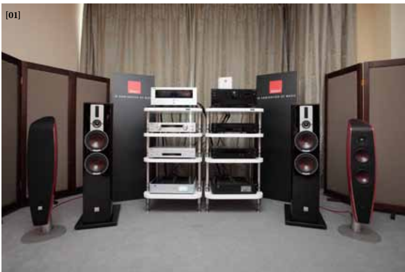
[01] — Наконец-то и отечественная публика смогла послушать новые референсные колонки фирмы Dali Epicon 6. Мы,

правда, успели их еще и протестировать — читайте о результатах лабораторных испытаний на с. 98. На выставке